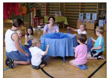
Bewegtes Abschlussfest unter dem Motto Feuer-Wasser-Luft- Erde