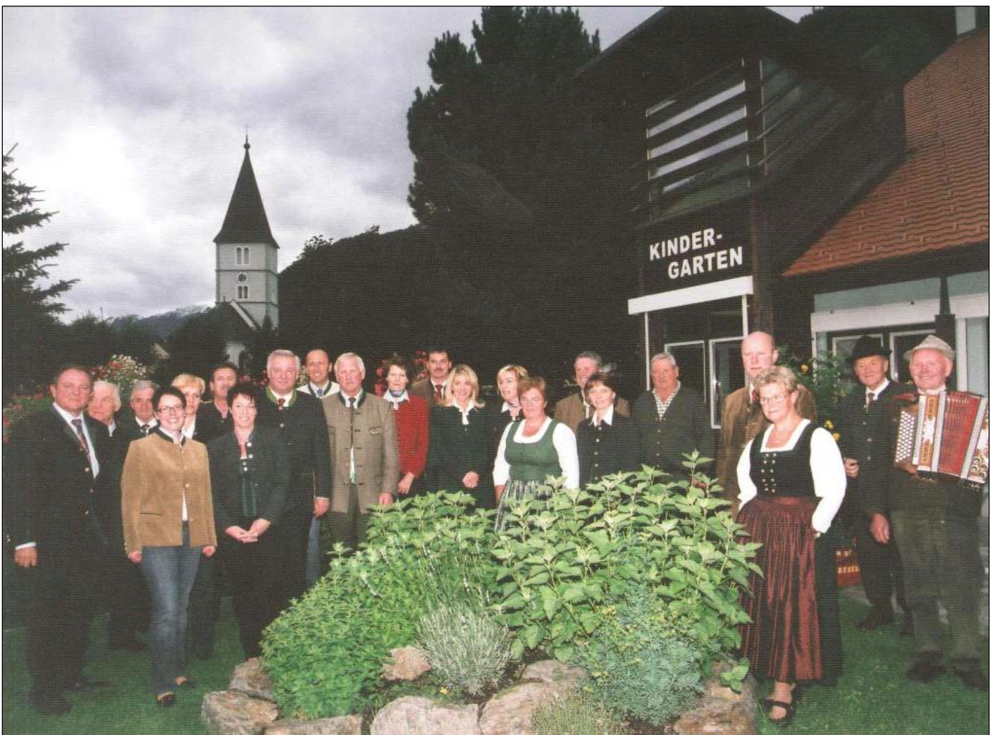
Landeshauptmann Stellvertreter Hermann Schützenhöfer besucht Pusterwald