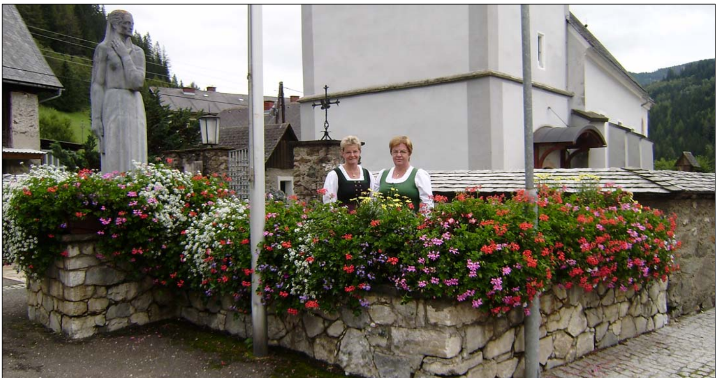
Wir können stolz sein, eines der schönsten Kriederdenkmäler der Steiermark