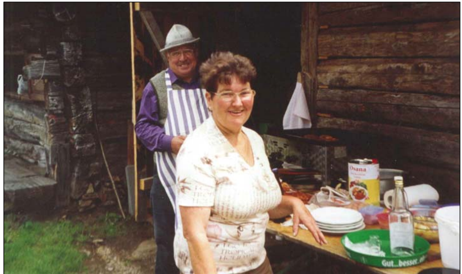
Grillen in Bretstein

In diesem Sinne wünschen wir allen Frohe Weihnachten und ein glückliches neues Jahr 2011.